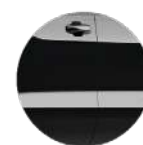
NEGRO GRAFITO METÁLICO (GB8)