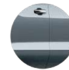
TIBURÓN METÁLICO (GRS2)