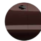
MOCHA TO METÁLICO (GGF)