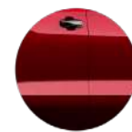
ROJO APERLADO (GVK)